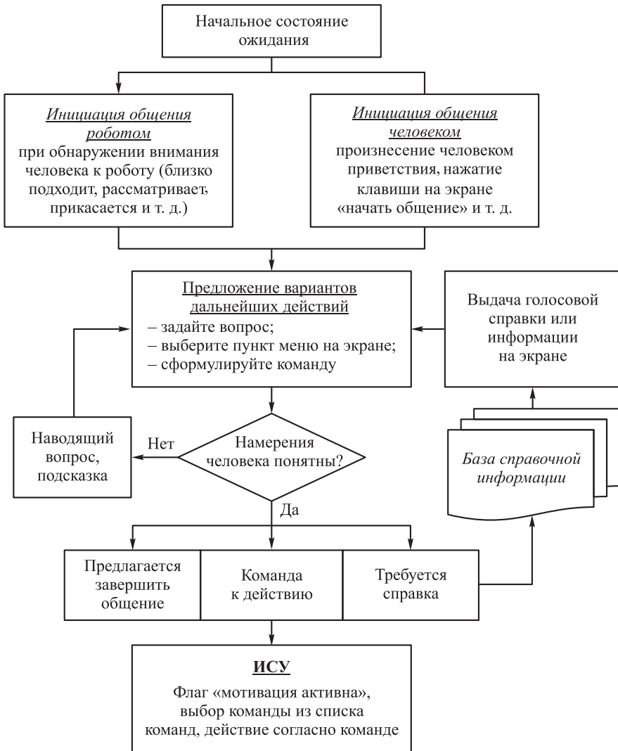
Рис. 3. Схема алгоритма функционирования интерфейса АМСР–человек

порядка действий и исключения неопределенности в многозадачных ситуациях. Этот элемент — блок принудительной формулировки мотиваций, приоритетов и команд (целеуказаний) — отсутствует в нейрофизиологии живых систем. Он присущ исключительно технической системе, созданной человеком. Поэтому здесь нейробиологические подходы «по аналогии» неприменимы, а следует опираться на какую-либо иную парадигму.